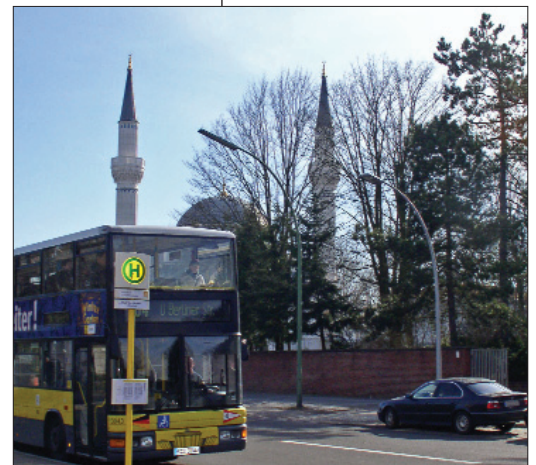
Şehitlik-Moschee in Deutschlands Hauptstadt Berlin, Stadtteil Neukölln

Der Dialog der Kulturen geht von einer Hochschätzung der Vielfalt und Verschiedenartigkeit aus und ist bemüht, in einer Haltung wechselseitiger Toleranz auch die Unterschiede auszuhalten, die zunächst fremd und verunsichernd wirken können. Die Unterschiede werden als Ausdruck gelebter Freiheitsrechte verstanden. Das Recht auf Anderssein führt zu einer Welt der Vielfalt. Die Grenze der Freiheit liegt in der Freiheit aller anderen begründet. Der Dialog ist nicht miss zu verstehen im Sinne: Alles ist möglich. Nicht jeder kulturelle Unterschied ist begrüßenswert oder tolerierbar. Dort, wo die Menschenrechte und die Toleranz unter Berufung auf die kulturellen Unterschiede und Eigenheiten relativiert oder missachtet werden sollen, gilt es entschieden zu widersprechen. Allerdings muss im Dialog auch die konsequente Anstrengung unternommen werden, die Perspektive der anderen Seite verstehen zu wollen und blockierende Vorurteile zu hinterfragen.