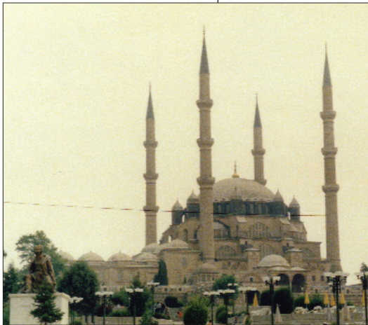
Die Moschee Selimiye Camii in Edirne, Türkei

Koran, aufgeschriebenes göttliches Wort, dass unmittelbar dem Propheten Mohamed offenbart wurde. Neben dem Koran gilt noch die Sunna als autoritativer Bezugsrahmen: Berichte der vorbildhaften Handlungen des Propheten. Koran und Sunna sind gemeinsam Rechtsquellen für die Scharia, das islamische Recht. Jon Esposito verdanken wir folgende knappe Zusammenfassung der islamischen Weltsicht. Die Weltsicht des Islam ist eine Vision individueller und gemeinschaftlicher Verantwortung; die Muslime müssen sich auf dem Weg Gottes (shari'a) grosse Mühe (dschihad) geben, um Gottes Willen auf Erden umzusetzen, um die muslimische Gemeinschaft (umma) auszudehnen und zu verteidigen, und um eine gerechte Gesellschaftsordnung zu etablieren. 12/ Der Islam ist ein allumfassender Lebensweg, der sich auf alle Bereiche des menschlichen Daseins erstreckt. Er ist eine Einheit von Religion und Gesellschaft/Politik oder aus säkularisierter Sicht formuliert: Islam kennt keine Trennung von Religion und Staat.