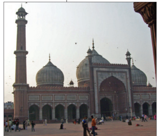
Jama Masjid, die Freitagsmoschee in Indiens Hauptstadt Neu-Delhi

Was aber ist der Islam? Er ist nicht gleichzusetzen mit Islamismus. Er ist nicht eine einheitliche Religion. Er ist nicht ein einziges Gesellschafts- und Staatsmodell. Islam gibt es nur im Plural. Der islamischen Welt gehören fast eineinhalb Milliarde Menschen in vielen Staaten der Welt an. Einen einheitlichen Islam gibt es nicht. Muslimische Gemeinschaften können sich je nach regionaler Tradition stark voneinander unterscheiden. So passt sich die Ausprägung des Islam in Indonesien, Senegal oder Ägypten den sozialen und kulturellen Gegebenheiten der jeweiligen Gesellschaften an und steht mit ihnen in Wechselwirkung. ... Die Vorstellungen darüber, wie ein islamischer Staat auszusehen habe, sind selbst innerhalb der islamischen und der islamistischen Bewegungen nicht einheitlich definiert. 1/1 Zu den regionalen Verschiedenartigkeiten kommen religiöse Unterschiede. Schließlich gibt es Differenzierungen im Islam je nach dem, wie man die Reformbedürftigkeit und Reformfähigkeit des Islam einschätzt. Islam ist also nicht Islam und auch die muslimische Bevölkerung Europas ist ähnlich verschieden wie die Länder, aus denen sie stammen. Hinzu kommt noch die besondere Diaspora-Situation in Europa, die zu einer eigenen europäischen Variante des Islam führen kann.